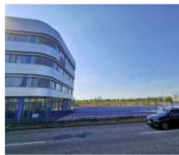
Hinter dem letzten Neubau von FAM an der Sudenburger Wuhne im Süden Magdeburgs sind große Flächen für Gewerbe reserviert.

MAGDEBURG. Für die Fläche südlich der Sudenburger Wuhne steht eine planerische Entscheidung an. Der Stadtrat soll am Donnerstag, 23. April, über die Änderung des bestehenden Bebauungsplans beraten. Dabei geht es um die zukünftige Nutzung eines Areals, das zuvor für eine Erweiterung von FAM vorgesehen war. Der Ausschuss für Stadtentwicklung, Bauen und Verkehr hat dem Stadtrat die Zustimmung bereits einstimmig bei zwei Enthaltungen